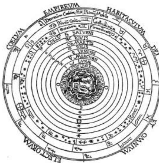
Il cosmo astrologico secondo la Cosmografia di Pietro Apiano

Ho guardato bene dappertutto nel passato; scorgo solo questa tetralogia elementale alla base del sapere tradizionale. Affiora anche l'etimologia planetaria: ne è testimone Camille Flammarion quando scrive di Marte, nella sua Astronomia Popolare : «La sua luce è rossastra, ardente come una fiamma e dà l'idea di un fuoco. Quale lo vediamo noi oggi, tale splendeva per i nostri antenati. Il suo nome, in tutte le lingue antiche, significava incandescente...» E poi, pensate che occorra scovare un «simulacro di Rappresentazione» per il Sole prima di ammettere che è per prima cosa e prima di tutto una palla di fuoco a cui è appesa la nostra vita?