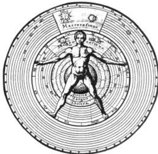
L'uomo microcosmo secondo Robert Fludd nel suo Virusque Cosmi... Historia, 1617 .

Ho guardato bene dappertutto nel passato; scorgo solo questa tetralogia elementale alla base del sapere tradizionale. Affiora anche l'etimologia planetaria: ne è testimone Camille Flammarion quando scrive di Marte, nella sua Astronomia Popolare : «La sua luce è rossastra, ardente come una fiamma e dà l'idea di un fuoco. Quale lo vediamo noi oggi, tale splendeva per i nostri antenati. Il suo nome, in tutte le lingue antiche, significava incandescente...» E poi, pensate che occorra scovare un «simulacro di Rappresentazione» per il Sole prima di ammettere che è per prima cosa e prima di tutto una palla di fuoco a cui è appesa la nostra vita?