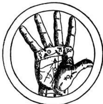
Chiromancie, gravure du XVII e siècle. La main et ses « monts planétaires », répartissant le système solaire dans l'espace de sa paume.

Ma, essendo l’arte la sublimazione delle nostre tendenze, portatrici del meglio e del peggio, in una evasione elevatrice, il comune mortale non è forse , minimamente e quotidianamente, sulla stessa barca, nel suo proprio modo di sentire la vita ?