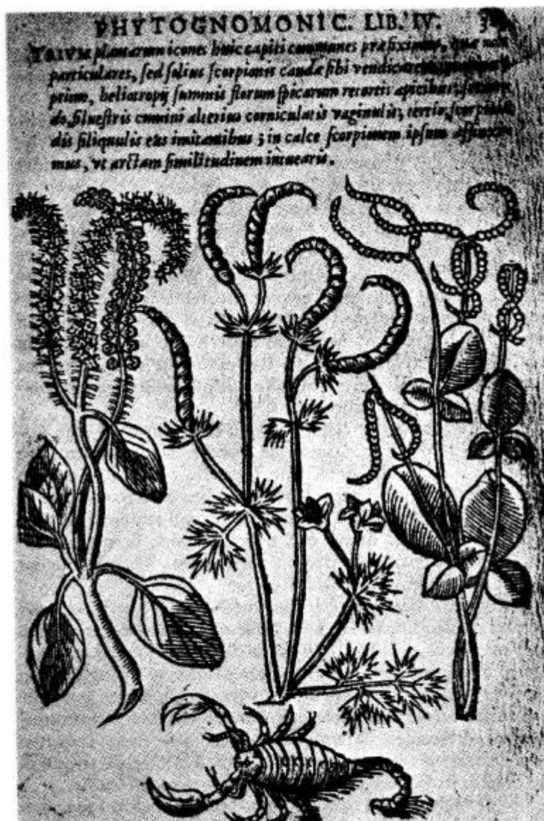
Planche extraite de la Phytognomonia (Naples, 1588) de Jean-Baptiste Della Porta. Ici, une signature mar- sienne : un passage s'opère du végétal à l'animal à travers les mêmes courbes crochetées et pointues des extrémités des plantes et des pattes, des pinces ainsi que de la queue du scorpion.

Nella sua “Filosofia del rinascimento” (Paris, 1974), Ernst Bloch ne ha fatto un felice commento: “All’ inizio della dottrina: il dentro ed il fuori vanno sempre insieme. La parola “dentro” non si intende, presso Bruno e Campanella, come un continuo. Il bello sguardo italiano sul mondo, sul quaggiù, non è certamente disprezzato dal medico filosofo, ma il lato interno del quaggiù, l’aspetto concavo, per così dire, è adesso percepito, e messo in evidenza, in tale maniera che né il dentro fa dimenticare il fuori, né il fuori il dentro; e più ancora: al “dentro” corrisponde un quaggiù, e soprattutto al “fuori” il lassù (lett., al di sopra, ndt) della volta cosmica: ciò che è in basso, è ugualmente in alto, e ciò che è in alto è ugualmente in basso. Il mondo è, quindi, una grande rete di corrispondenze: dall’interno all’esterno e viceversa. Ed il mondo non è riconoscibile fino a quando l’uomo, quindi l’interno, il soggetto, non è colto come il suo primo, e simultaneamente come il frutto del mondo. Non che l’esterno sia stato generato dall’interno, ma senza l’interno ci manca la chiave per aprire l’esterno. Questo pensiero, Paracelso lo proietta poi sull’immensità dell’universo esterno, poiché ben più ancora l’esterno dell’uomo non è intelligibile, esso lo deduce dal mondo, come il frutto dalla semenza. Così il