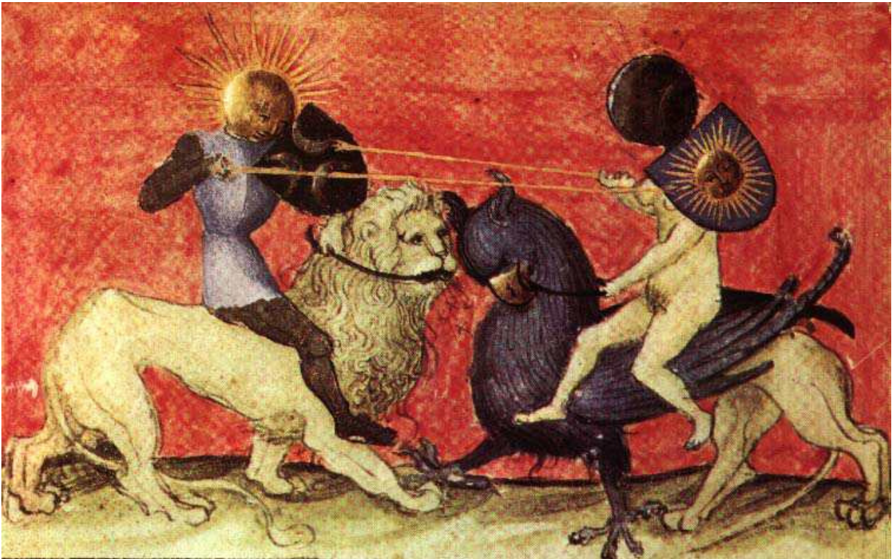
Miniatura tratta da Aurora consurgens (sec. XV?). Zentralbibliothek di Zurigo (MS. Rhenoviensis 172).

Maier intitola l’emblemata Sol indiget luna, ut gallus gallina (Il Sole ha bisogno della Luna come il gallo della gallina). L’epigramma recita: