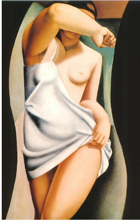
Le modèle (Tamara de Lempicka, 1925)

“Se uno non ha niente dentro, non troverà mai niente fuori. È inutile andare a cercare nel mondo quel che non si riesce a trovare dentro di sé.”